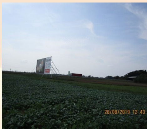
Oglaševanje na kmetijskih površinah je prepovedano.