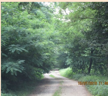
Odstranjevanje vej, ki segajo na javno površino.