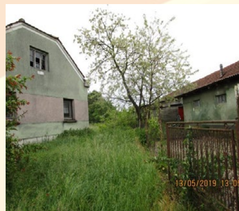
Stavbna zemljišča vzdrževati-kositi.